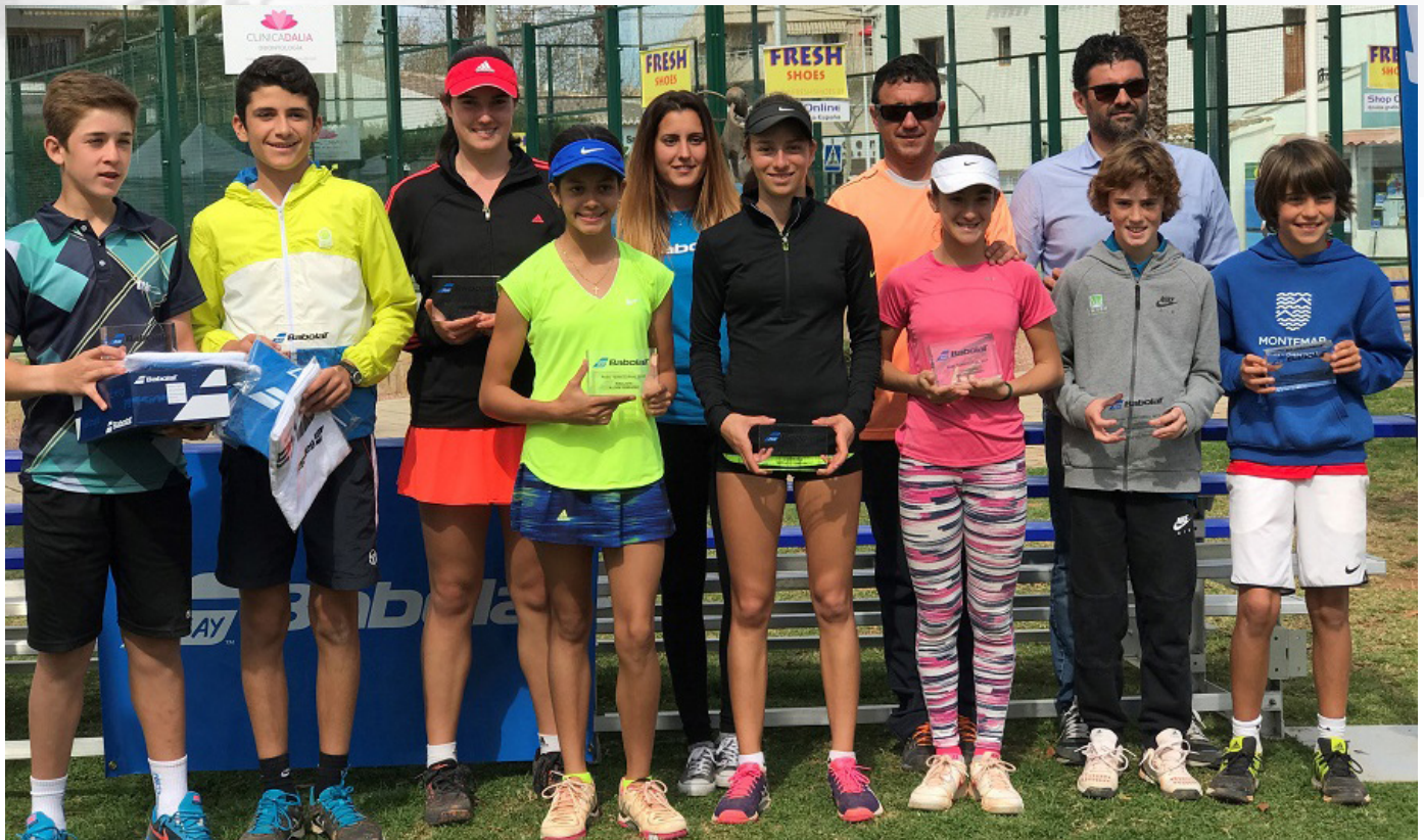
Campeones y finalistas de la Babolat Cup en la prueba de la Comunidad Valenciana en Jávea