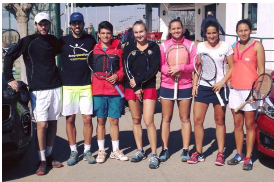
Jugadores/as participantes en el Open de la Magdalena 2017

Una vez más, la Diputación y el Ayuntamiento de Castellón estuvieron presentes en la organización del Torneo de la Magdalena , que gracias a este apoyo, suma más raquetas en cada edición.