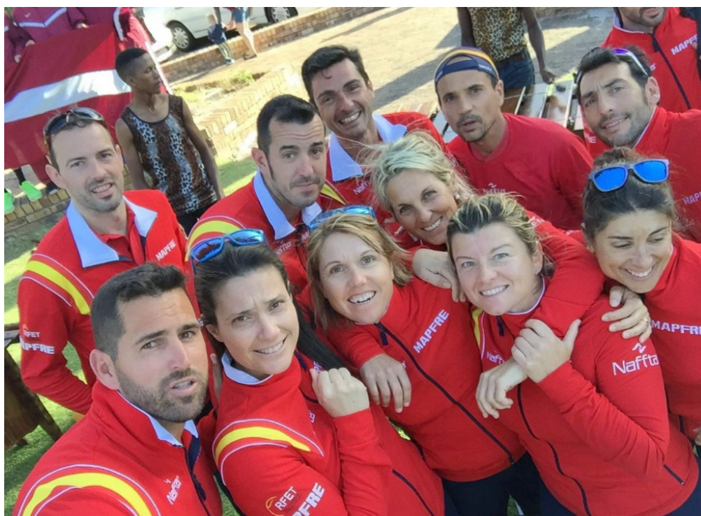
Foto de familia componentes selecciones españolas en Ciudad del Cabo

Finalmente no pudo ser y las selecciones españolas +40, masculina y femenina , que han participado en la "Young Seniors" han sido subcampeonas del Mundo.