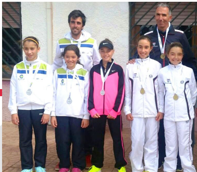
Equipos Alevín femenino CT Valencia y CT El Collao

El equipo Alevín femenino del Club de Tenis Valencia se impuso también el domingo 5 de marzo al equipo del Club de Tenis El Collao por 2-1 . Las de El Collao recibían en casa a las del CT Valencia, que se llevaban el título de equipo Campeón de 1ª División de la Comunidad Valenciana .