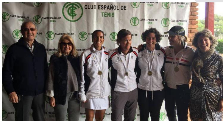
Equipo Veteranas +40 Club Español de Tenis

El pasado domingo día 5 de marzo se disputó en las pistas del Club Español de Tenis de Rocafort la final del Campeonato por Equipos de Veteranas +40 de la Comunidad Valenciana , donde las locales se impusieron a las del Club de Tenis Valencia , adjudicándose el título de Campeonas .