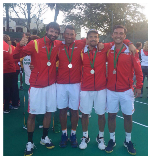
Selección española Veteranos +40