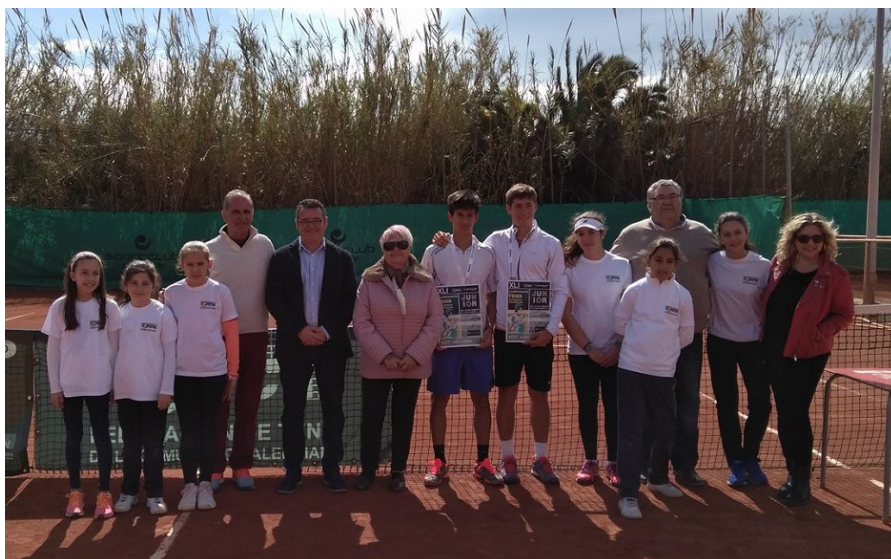
Entrega de trofeos en la final masculina: campeón, finalista, autoridades y recogepelotas