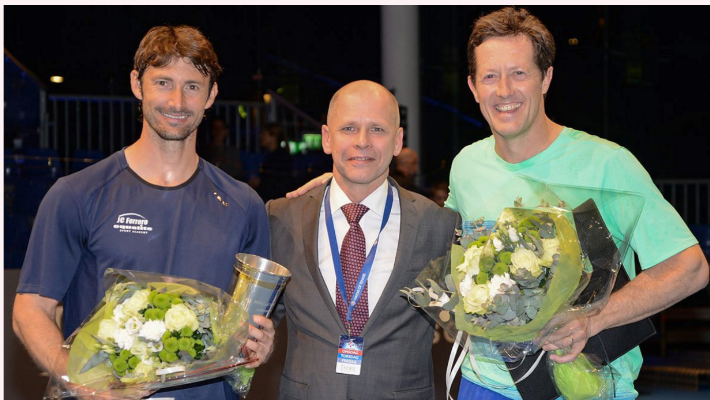
Juan Carlos Ferrero y Jonas Bjorkman recibiendo sus trofeos de Campeón y finalista, respectivamente

"Fue increíble jugar aquí esta semana en un escenario tan magnífico y por supuesto, jugar la final contra Jonas, ante un público muy animado, fue muy divertido", dijo Ferrero . "Espero volver el próximo año".