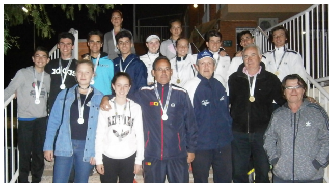
Equipos Cadete CT Valencia y CT Torrevieja