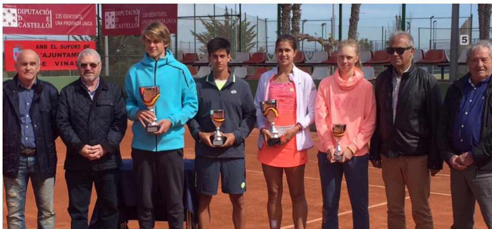
Foto de grupo en la entrega de trofeos con los cuatro finalistas